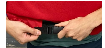
4 扣環扣好後，帶子拉緊