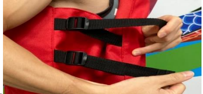
2 腰部左右各2條帶子拉緊